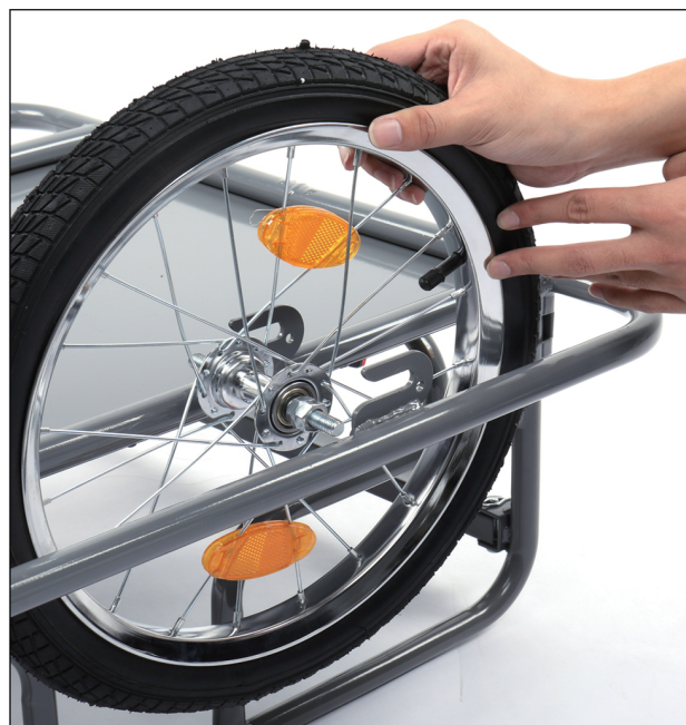
6-insert the wheel axles into the slots provided.