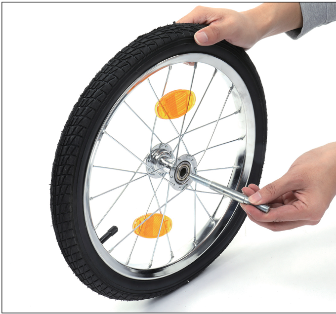
3-Insert the axle into the wheel.