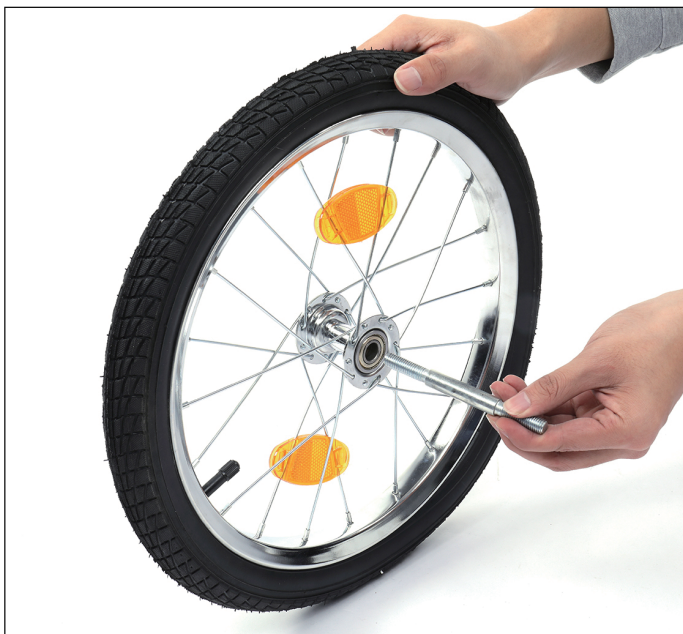
3-Insérez l'axe dans la roue.