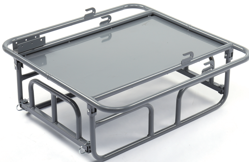
5-Retournez la remorque.